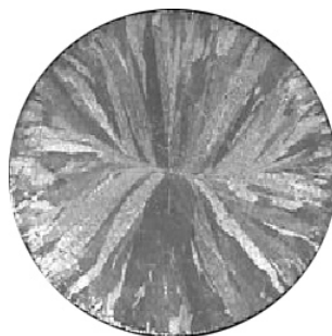
Kokillenguss 950 °C